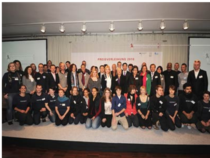
Die Preisträger und Nominierten des Bundeswettbewerbs Aids-prävention 2010